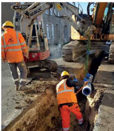
Mise en place d'une canalisation en té pour le raccordement entre l'avenue du Général de Gaulle et la rue du Maréchal Leclerc.

L'entreprise SARC (Société Armoricaine de Canalisation), basée à Saint-Julien-de-l'Escap en Charente-Maritime, réalise les travaux pour le compte d'Eau 17. L'agence SOCAMA de Saintes suit les opérations en qualité de maître d'œuvre.