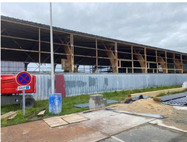
Dépose de l'ancien bardage