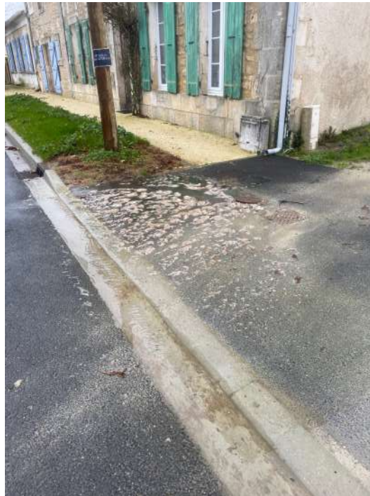
Eaux usées sur domaine public avenue du Général de Gaulle

Suite au diagnostic réalisé en 2018, d'autres renouvellements de réseau seront à prévoir dans les années futures.