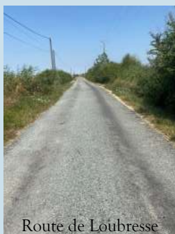
Route de Loubresse