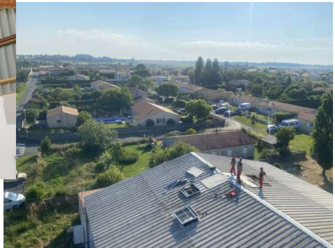
Pose de nouveaux lanterneaux