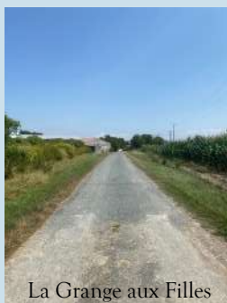
La Grange aux Filles

Montants des interventions sur l'ensemble des voiries et chemins : 10 425.50 € (point à temps compris).