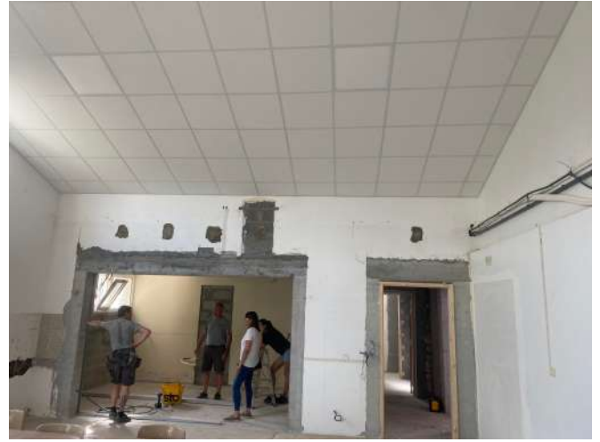
Petite salle : création d'une cuisine et d'un accès indépendant aux sanitaires