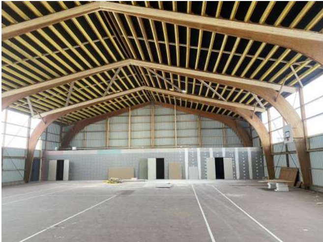
Création de locaux de stockage