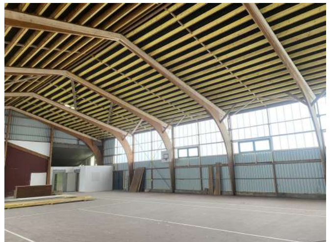
Renforcement charpente existante