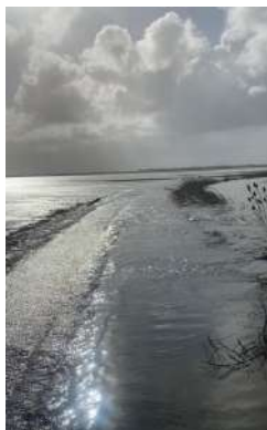
Route des Tannes submergée par l'eau de mer

Notre commune, dans les années à venir, connaîtra inévitablement de grosses modifications de son environnement et de ses limites de territoires.