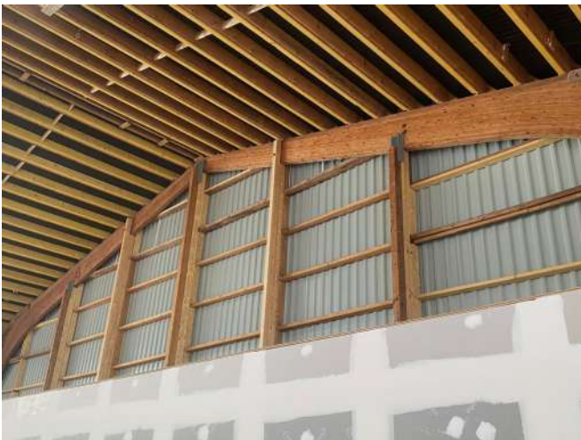
Renforcement pignon Sud exposé aux tempêtes (poutres blanchies)