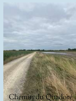
Chemin du Quadore